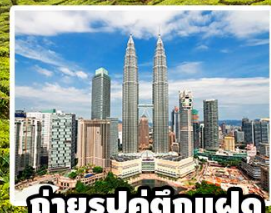
ถ่ายรูปคู่ตึกแฝด