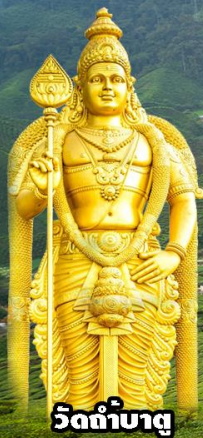
วัดถ้ำบาตู

ปุตราจายา-คาเมรอน-เก็นติ้ง-กัวลาลู 3วัน2 คืน โดยสายการบิน มาเลเซีย แอร์ไลน์ (MH)