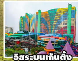
อิสระบนเก็นติ้ง